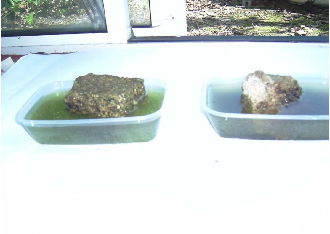
Figure 2: Şekil 1’de EMa ilave edilmiş olan kap burada sağda görünüyor. Soldaki ise kontrol.